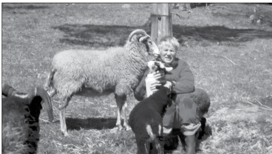
När ett litet flasklamm ska matas är det fler som är nyfikna.